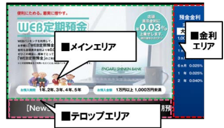
サイネージの画面イメージ