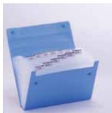
＜ドキュメントファイル＞