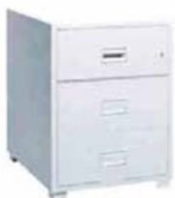
＜JIS 耐火印鑑票キャビネット＞