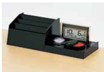
＜デジタルカレンダー付伝票ケース＞