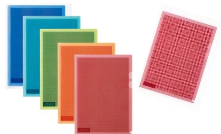
＜カモフラージュホルダー＞