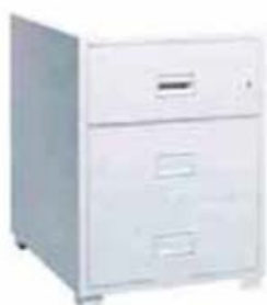
＜JIS 耐火印鑑票キャビネット＞