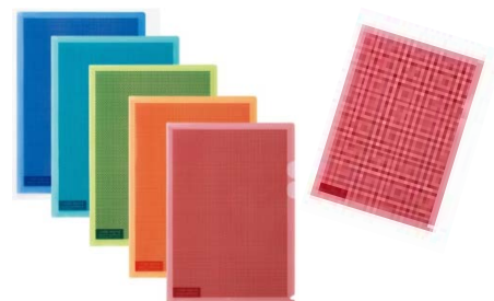
＜カモフラージュホルダー＞