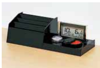
＜デジタルカレンダー付伝票ケース＞